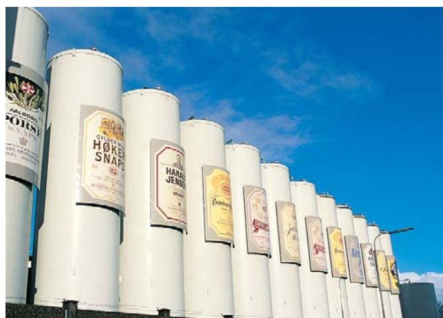
Spritfabrikernes iøjnefaldende siloer lader ingen i tvivl om, hvad der produceres her. Desværre opbevares snapsen ikke her, men i store tanke inde på fabrikkens.

Skeelslund · DK-9440 Aabybro Tlf. 98 24 47 10 · Fax. 98 24 47 58 e-mail: info@snapseruten.dk www.snapseruten.dk